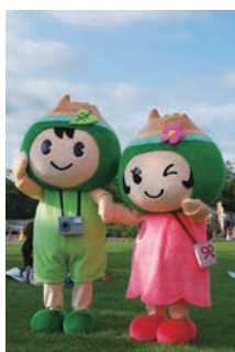
ポロトくん・ポントちゃん

種目別全国交流大会(10種目)・特別協賛行事(4種目)を実施します。全国から参加の愛好者と地元住民との交流をお楽しみください。