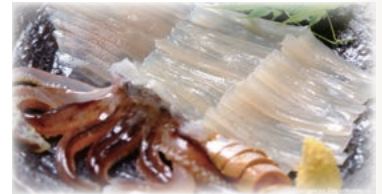
北海道の食【イカさし】