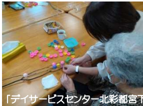
「デイサービスセンター北彩都宮下」