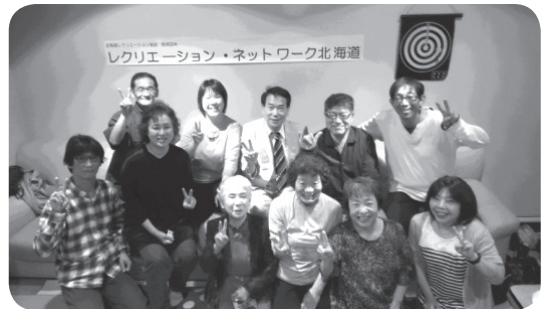
会員の交流・情報を共有し、支部の レク活動を積極的にすすめる。 レクリエーション・ネットワーク北海道

勝っても、負けても笑い溢(あふ)れる コミュニケーションスポーツの拡大!! 北海道ディスコン協会