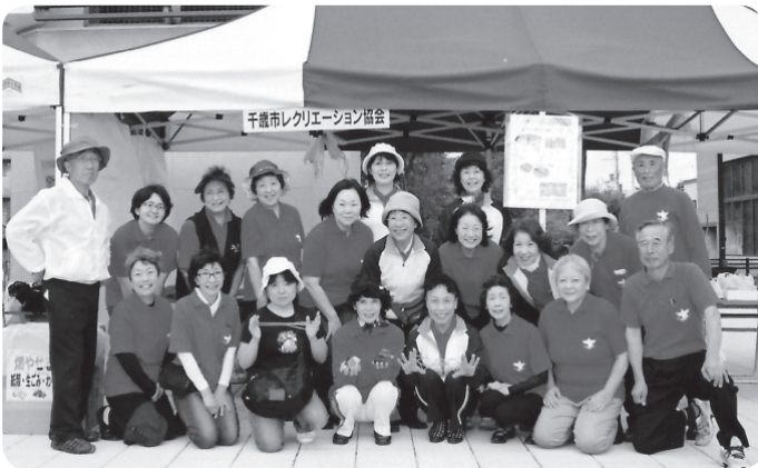
笑顔で活動推進。全国レク大会函館で友情の輪を広めたい! 千歳市レクリエーション協会