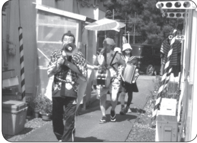
2年ぶりの陸前高田訪問