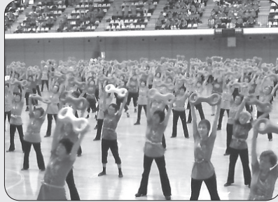
45周年大会 in 北海道