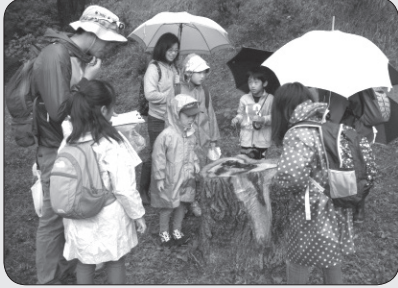
市民交流ウォークラリー大会