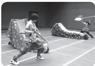
オープニング「獅子舞」