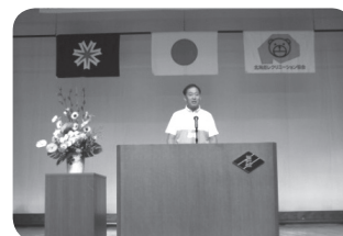
来年は函館で全国大会です。皆さん、ぜひ参加して下さい。