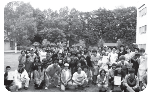
和気あいあいの中で記念撮影

また、未経験の方は、来年の大会に是非参加してみてください。今大会の優勝は札幌国際大学の新井ゼミ。「来年こそは学生チームを倒すぞ」と意欲を見せる多数のチームが見られました。