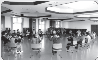
市民レク・リズム体操