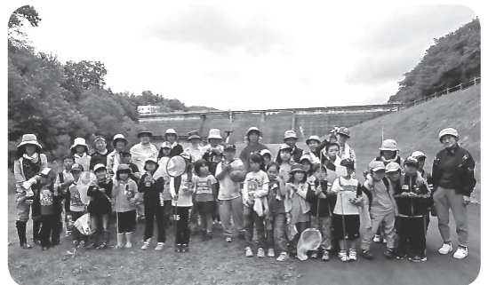
レク活動で子どもも高齢者も笑顔 南十勝年輪レクリエーション協会