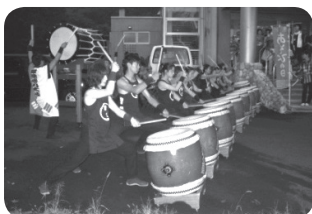
交歓会オープニング「太鼓演奏」