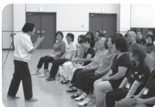
ホスピタリティトレーニング&レクダンス