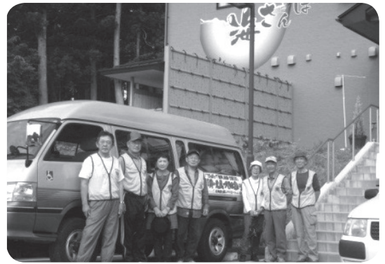
全員笑顔絶やさず笑顔満開で! 七飯レクリエーション協会