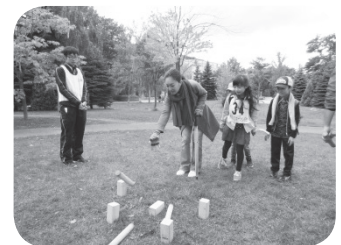
スポーツ体験ークップ

を久しぶりに歩きました。」「親子で問題を解きながら、公園の遊具やカモと遊び、楽しい時間を過ごせました。来年も参加します。」という感想もありました。