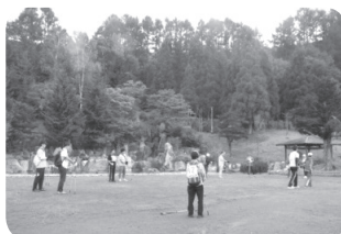
ノルデックウォーキング