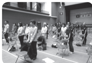
いきいき百歳体操