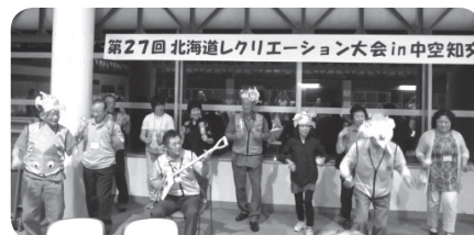
スコップ三味線で「俺のふるさと北海道」