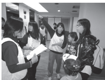
ウォークラリー大会

本学では理論と実技を終えた学生に対して、さらに「レクリエーション実習」という科目を設け、個別で指導を体験する授業に加え、北海道レクリエーション協会の事業はもちろん、さまざまな事業にボランティアスタッフとして積極的に参加しております。