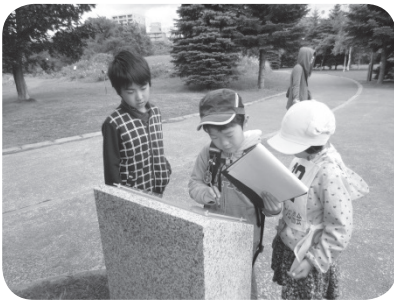
これは何?...。真剣です。