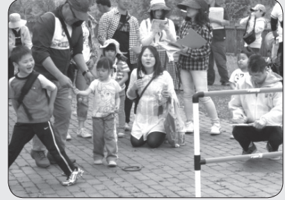
アメニティーウォークラリー大会