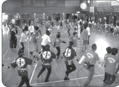
あそびの日 (参加者全員でレクダンス)