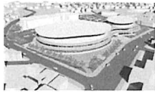
全国大会メイン会場 函館アリーナ