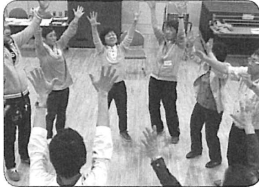
平成27年度 前期中空知レクリエーション楽園