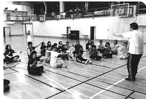
会員拡大を目指して、更なる活性化を目指す 釧路レクリエーション協会