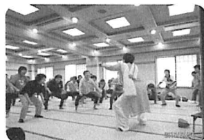
カッコよくワッハッハ～