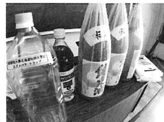
スズメバチトラップの材料

この授業は、全学科対象の開設科目でレクリエーションに興味がある学生や教職課程の学生が履修しています。新たな開講科目のため手探りで授業を進めていますが、滝川市の地域イベントである「えべおつ丘陵地マラニック（マラソン＋ピクニック）」やスズメバチを日本酒、砂糖、酢を配合した誘引液をペットボトルに入れて捕獲する「スズメバチトラップ」の作成など地域貢献や自然環境を活かした取り組みを実践しています。