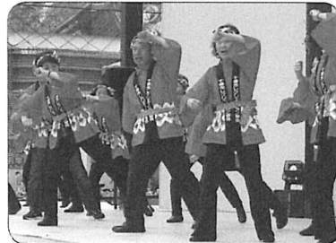
今年初めて街中での開催「ふるさとポケット」