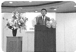
大会が始まります