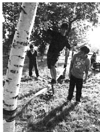
公園でスラックライン体験

本校では、平成27年度より前期に「レクリエーション理論」、後期に「レクリエーション実技」を開講してレクリエーションインストラクター資格を目指す学生を養成しています。