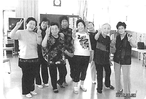
仲間みんなといつも笑って楽しめるレク協会にしていきたい 伊達レクリエーション協会

「レククラブを立ち上げてやっと9年!! 明るい笑顔あふれるクラブに!!! とうや湖レククラブ