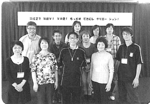
レクを愛し、広がる仲間の輪を目指し楽しく頑張る レクリエーション・ネットワーク北海道