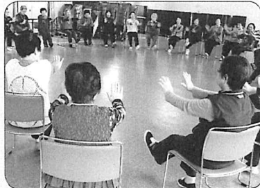
市民レクゲーム大会