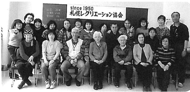
会員の高齢化にもめげず、持ち前の笑顔とパワーで頑張るぞ！ 札幌レクリエーション協会