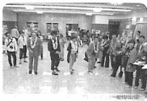
ゆうしょうめざして