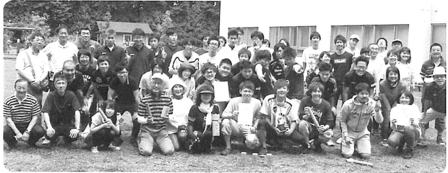
～手をつなごう～ (2015 北海道カップ大会)