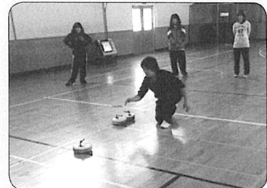
レクリエーション学苑