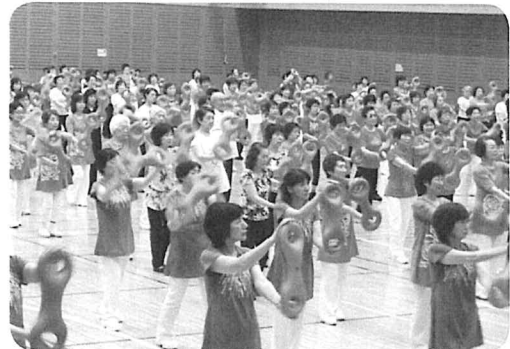
創立 45 周年記念大会 北海道支部のつどい開催 公益社団法人日本 3B 体操協会