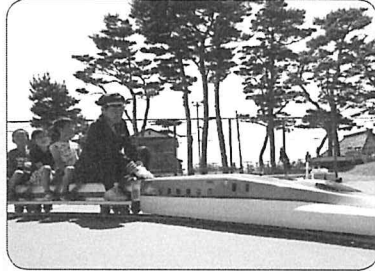
赤松街道を走る北海道新幹線