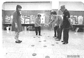
どっちが近い? (ディスコン)