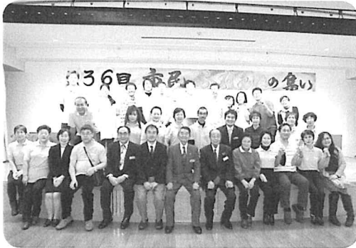
地域に楽しいを広げます!笑顔づくりの応援隊 中空知レクリエーション協会