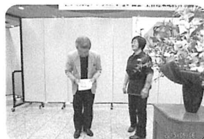
旗の引きつぎ ～中空知へ～