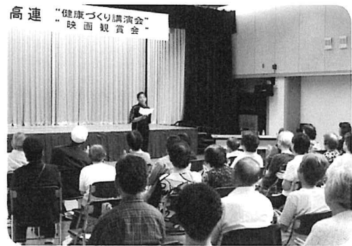
介護現場職員やボランティア・ 高齢者団体のレク支援に務めます！ ケアレクリエーション倶楽部