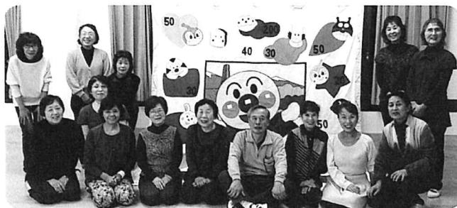
～手作りアンパンマン的あて完成～ 笑顔でまた躍動「モンキージャンプ」 千歳市レクリエーション協会

今年も市民にレクリエーションを届け、 市民の方が笑顔で暮らせるような支援をする 旭川レクリエーション協会