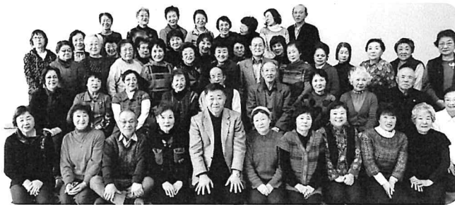
老後の孤独解消と協調心で健康な 日常生活のお手伝いがレク協の使命 登別レクリエーション協会

今年も市民にレクリエーションを届け、 市民の方が笑顔で暮らせるような支援をする 旭川レクリエーション協会